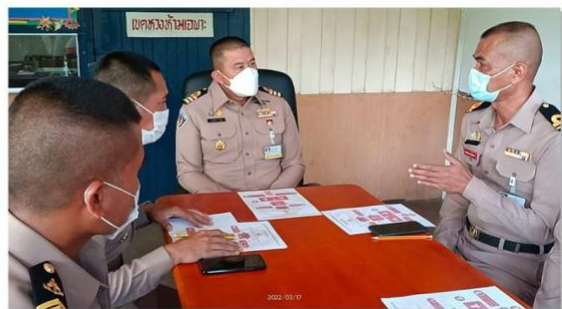
รูปที่ 4 การประชุมการจัดการความรู้ พัน.สท.ทร.ที่ 2 ฯ