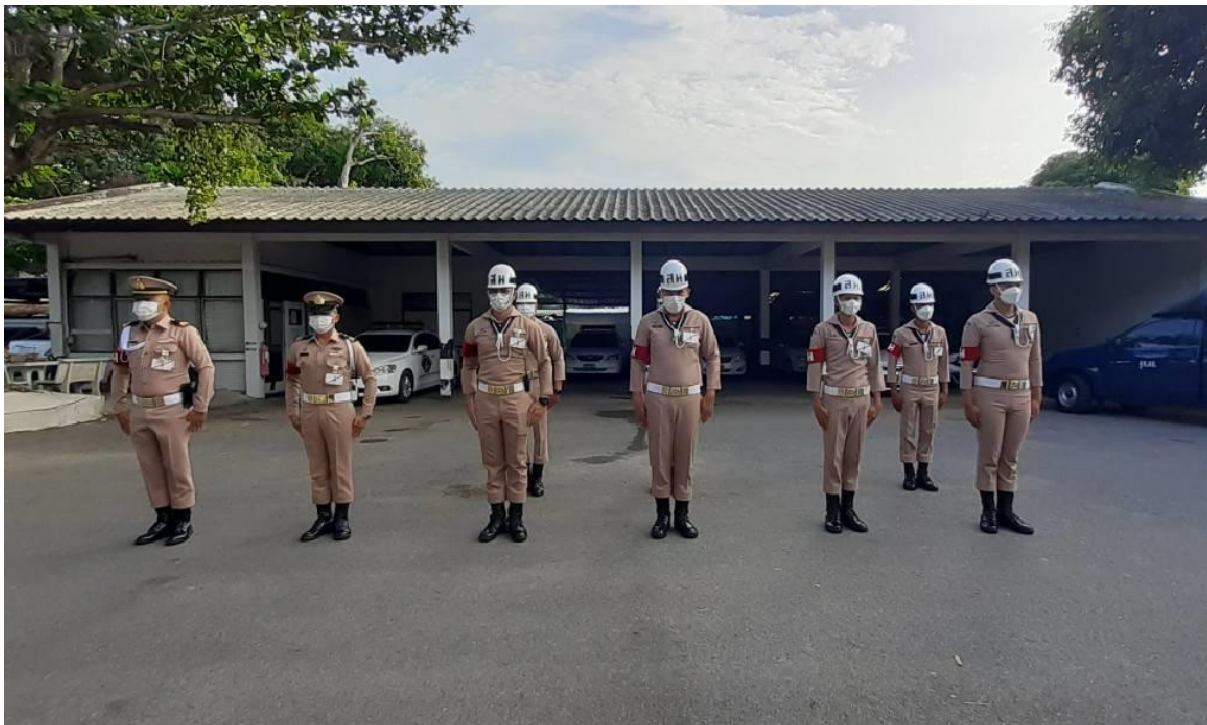
รูปที่ 2 จัดเตรียมกำลังพลและยานพาหนะ

นายทหารเวรสั่งการหรือนายทหารเวรประจำวัน แจ้งกองร้อยจัดเตรียมกำลังพล หมวดขนส่งจัดเตรียมรถบรรทุกขนาดเล็ก จำนวน 1 คัน ,หมวดรถนำขบวน จำนวน 1 คัน แลวพร้อมออกปฏิบัติหน้าที่